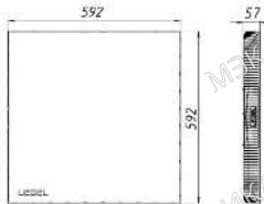
Рисунок 1 Светильник «L-office 32 S Premium»